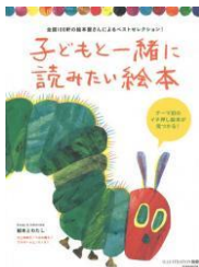
子どもと一緒に 読みたい絵本