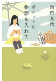
ポケットに物語を 入れて