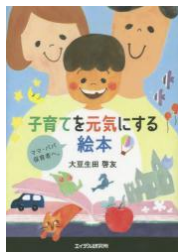
子育てを元気に する絵本