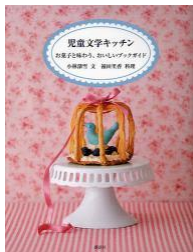
児童文学キッチン