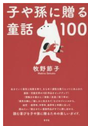
子や孫に贈る 童話100